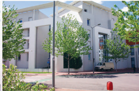
3 Résidence Pompidou