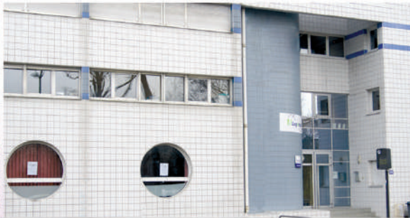
2 Résidence Saint-Cosme