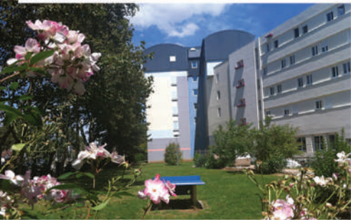
1 Résidence Jeunes Actifs