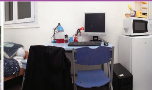
1 Résidence Jeunes Actifs 18 avenue Pierre Nogue - 71100 Chalon sur Saône